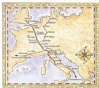
Immagine Studio Guidotti

Collaborazione: Gal Garfagnana Ambiente e Sviluppo. Info: 0583644435